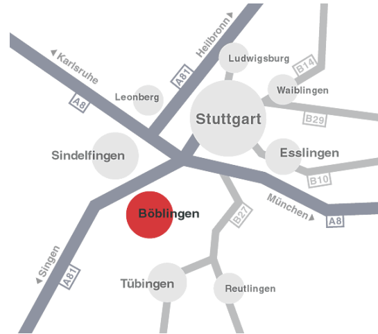
Abb. 2 Übersichtskarte